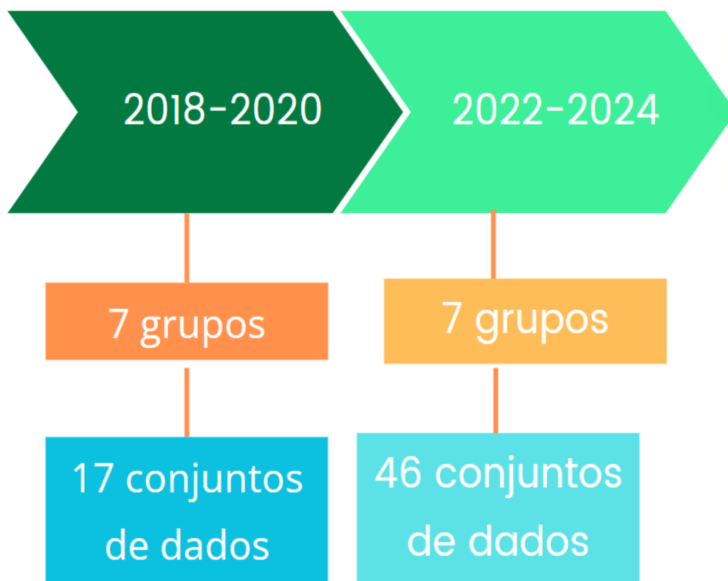
Gráfico 1: Quantidade de grupos e conjunto de dados planejados nos PDAs do IF Sudeste MG

O Gráfico 1 representa a linha do tempo dos Planos de Dados Abertos com os quantitativos de conjuntos de dados que foram planejados para abertura pelo IF Sudeste MG.