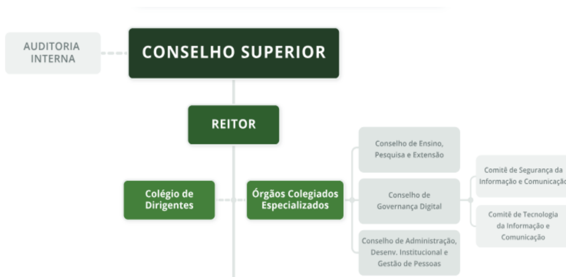
Figura 1: Extrato do organograma do IF Sudeste MG com destaque para os órgãos superiores e colegiados.

Conforme é demonstrado na Figura 1, o IF Sudeste MG possui cinco órgãos colegiados especializados. Dentre eles e para os fins de avaliação e aprovação deste plano, tem-se o Conselho de Governança Digital do IF Sudeste MG, que de acordo com o disposto no Decreto N.º 10.332, de 28 de abril de 2020, é órgão de natureza estratégica e de caráter permanente cuja finalidade é deliberar sobre os assuntos relativos à implementação das ações de governo digital e ao uso de recursos de tecnologia da informação e comunicação.