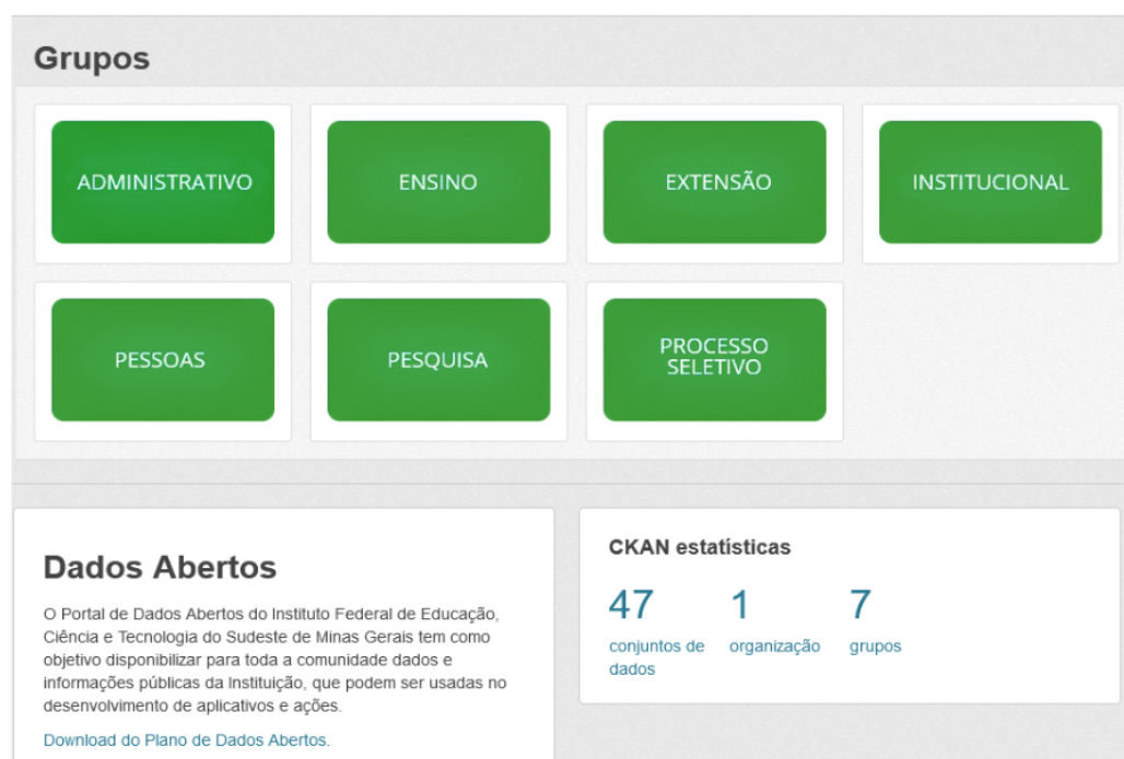
Figura 4: Grupos de Dados Abertos disponibilizados pelo IF Sudeste MG, janeiro de 2025

Iniciando o ano de 2025 o conjuntos de dados sobre Necessidades Educacionais Especiais foram abertos compondo o grupo Ensino. Deste modo, estão disponibilizados 47 conjuntos de dados, conforme demonstrado na Figura 4