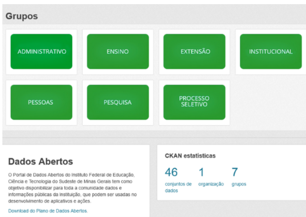
Figura 3: Grupos de Dados Abertos disponibilizados pelo IF Sudeste MG, a partir do Plano de Dados Abertos 2022-2024.