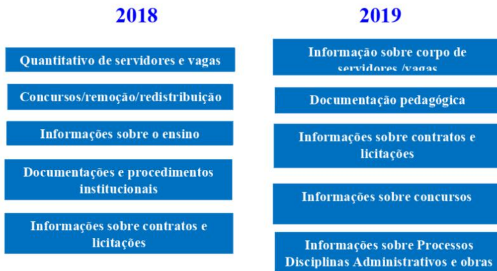
FIGURA 1: Dados demandados pelo cidadão por meio do e-SIC em ordem decrescente de frequência.

A FIGURA 1, abaixo, mostra o resultado das demandas recebidas pelo e-SIC nos anos de 2018 e 2019, classificados entre 1º e 5º lugar.