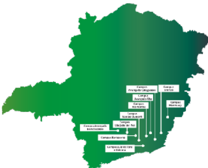
FIGURA 1. Mapa com a localização dos campi do IF Sudeste MG

O Instituto Federal de Educação, Ciência e Tecnologia do Sudeste de Minas Gerais (IF Sudeste MG) foi criado em dezembro de 2008, pela Lei Nº 11.892/2008 e integrou, em uma única instituição, o Centro Federal de Educação Tecnológica de Rio Pomba (Cefet-RP), a Escola Agrotécnica Federal de Barbacena e o Colégio Técnico Universitário (CTU) da UFJF. Atualmente a instituição é composta por campi localizados nas cidades de Barbacena, Bom Sucesso, Cataguases, Juiz de Fora, Manhuaçu, Muriaé, Rio Pomba, Santos Dumont, São João del-Rei, e Ubá. O município de Juiz de Fora abriga, ainda, a Reitoria do instituto.