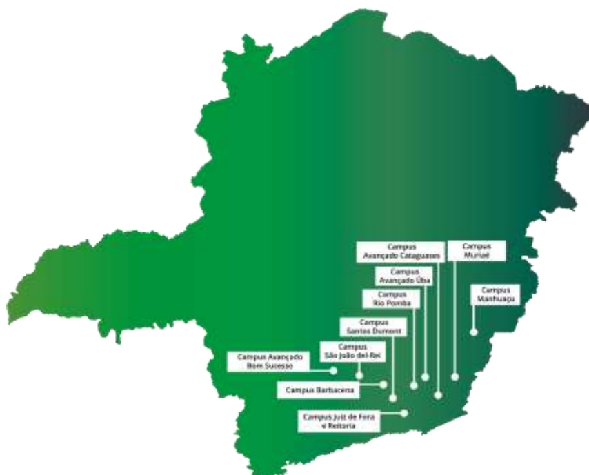
FIGURA 1. Mapa com a localização dos campi do IF Sudeste MG

O Instituto Federal de Educação, Ciência e Tecnologia do Sudeste de Minas Gerais (IF Sudeste MG) foi criado em dezembro de 2008, pela Lei Nº 11.892/2008 e integrou, em uma única instituição, o Centro Federal de Educação Tecnológica de Rio Pomba (Cefet-RP), a Escola Agrotécnica Federal de Barbacena e o Colégio Técnico Universitário (CTU) da UFJF. Atualmente a instituição é composta por campi localizados nas cidades de Barbacena, Bom Sucesso, Cataguases, Juiz de Fora, Manhuaçu, Muriaé, Rio Pomba, Santos Dumont, São João del-Rei, e Ubá. O município de Juiz de Fora abriga, ainda, a Reitoria do instituto.