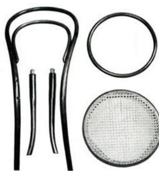
Figura 2: Cadeira Thonet (desmontada)

< https://hardecor.com.br/as-modernas-cadeiras-thonet/ >. Acesso em: 15 set. 2017.