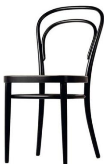
Figura 1: Cadeira Thonet (montada)

A simplificação é um conceito de projeto que visa reduzir os custos de fabricação e de material, diminuir o tempo de trabalho, de acabamento. Além disso, busca desenvolver formas simples, elegantes e bem resolvidas ergonomicamente. Simplificar exige bastante criatividade. A cadeira Thonet composta por seis partes e criada em 1796 por Michel Thonet (Figuras 1 e 2), é um ícone do Design, que atende muito bem aos requisitos da simplificação. Crie uma cadeira que atenda aos requisitos da simplificação, sendo também composta por seis partes. Faça o desenho da sua cadeira montada, em perspectiva, no espaço abaixo.