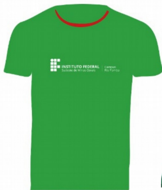
Modelo com manga