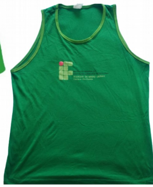
Modelo sem manga