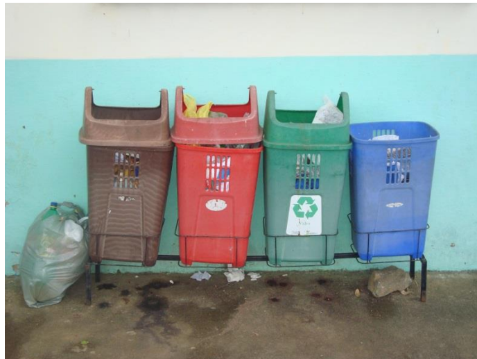
Figura 2. Coleta seletiva de lixo. (Foto: P.R.B. MELO).