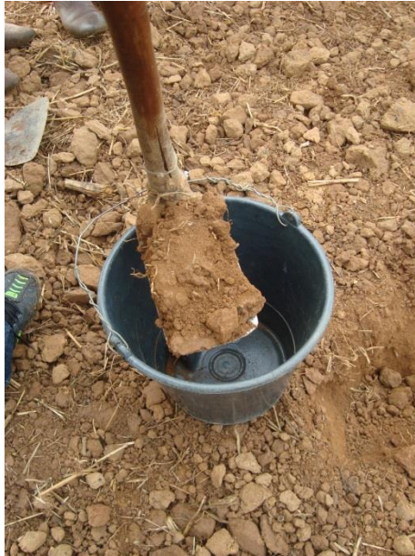
Figura 1. Retirada de amostras simples de solos.