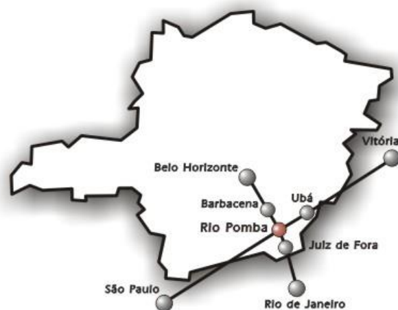
Figura 2 – Localização do município de Rio Pomba

O Instituto Federal de Educação, Ciência e Tecnologia do Sudeste de Minas Gerais – Campus Rio Pomba (IF Sudeste MG – Campus Rio Pomba) está situado no município de Rio Pomba, microrregião de Ubá, no centro do eixo Belo Horizonte - São Paulo - Rio de Janeiro – Vitória (ver Figura 2).