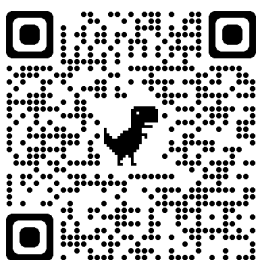
Figura 1. Acesso à plataforma SIGAA

2.1 As inscrições para o processo seletivo deverão ser realizadas através do SIGAA pelo link https://sig.ifsudestemg.edu.br/sigaa/logar.do?dispatch=logOff , de acordo com o Tutorial ( https://www.youtube.com/watch?v=Q5U07uLkx-I ) e no período de 12/05 a 21/05/2023. Se preferir pode escanear os Qrcodes abaixo: