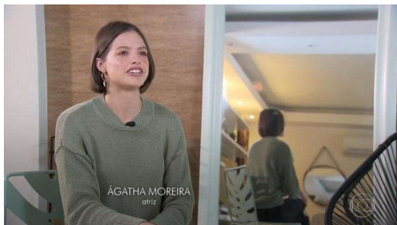
(Fig. 04 – Depoimento/Entrevista com “ar documental”).