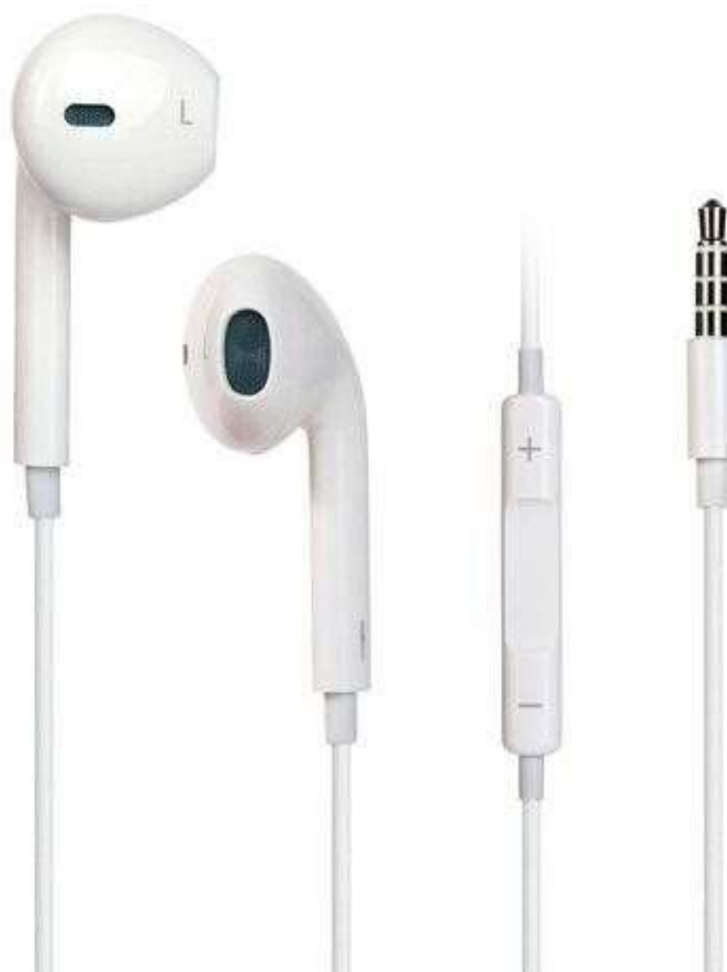
(Fig. 08 – Exemplo de fone de ouvido, com fio, com microfone embutido).