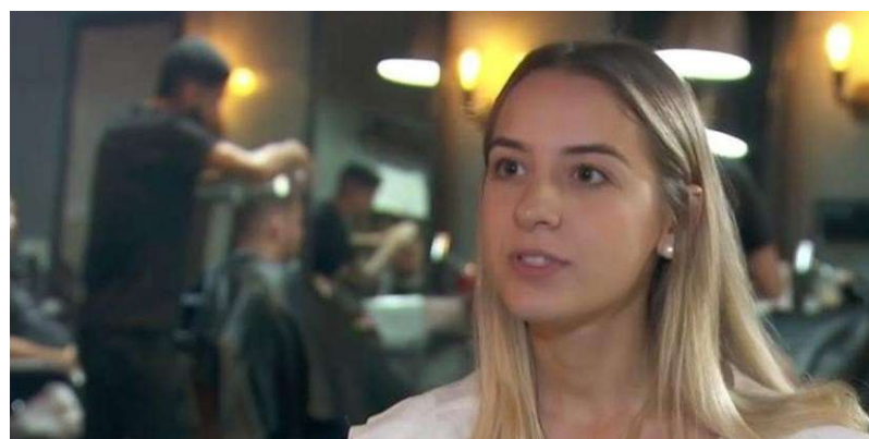
(Fig. 05 – Depoimento/Entrevista com “ar documental”).