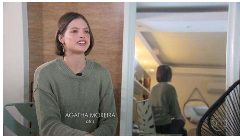
(Fig. 04 – Depoimento/Entrevista com “ar documental”).