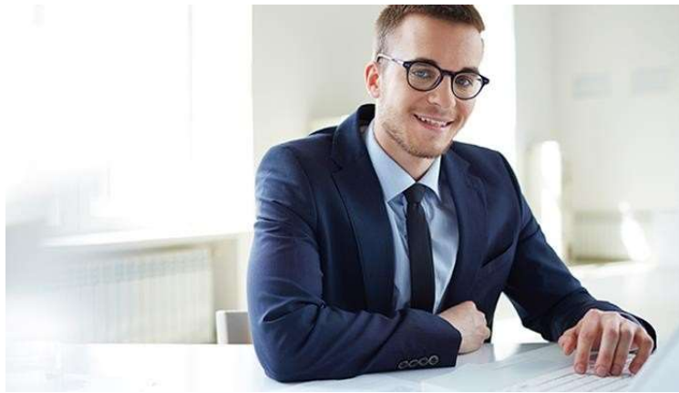
(Fig. 03 – Roupas contrastando o fundo).