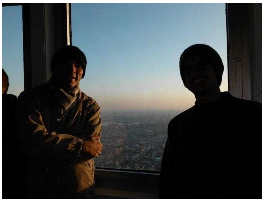
(Fig. 07 – Foto com contraluz forte = câmera automaticamente escureceu o restante).