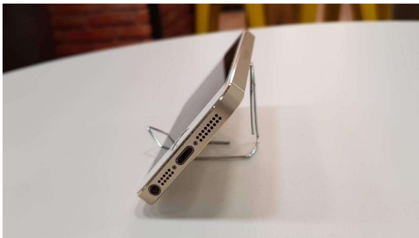
(Fig. 02 – Como apoiar celular - Link http://www.bit.do/apoio-celular ).

A possibilidade de alguém filmar fica em último caso, pois a “câmera na mão” gera movimentos inevitáveis e causa desconforto para quem está assistindo. Se realmente não for possível apoiá-lo, peça para que a pessoa que irá filmar use as duas mãos e evite movimentos.