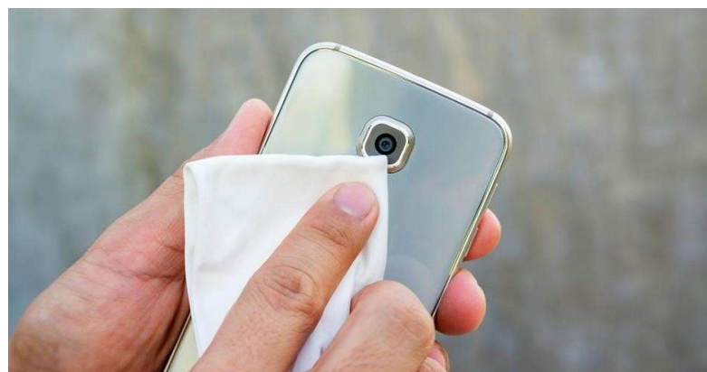
(Fig. 01 – Limpe a lente do celular antes de gravar)