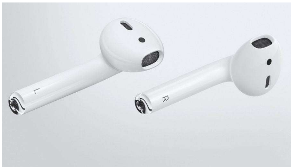
(Fig. 09 – Exemplo de fone de ouvido, sem fio, com microfone embutido).