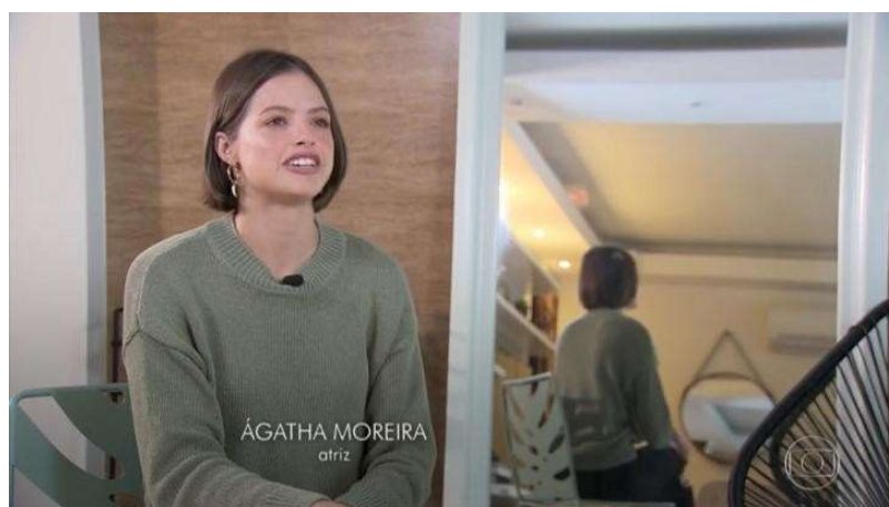
(Fig. 04 – Depoimento/Entrevista com “ar documental”).