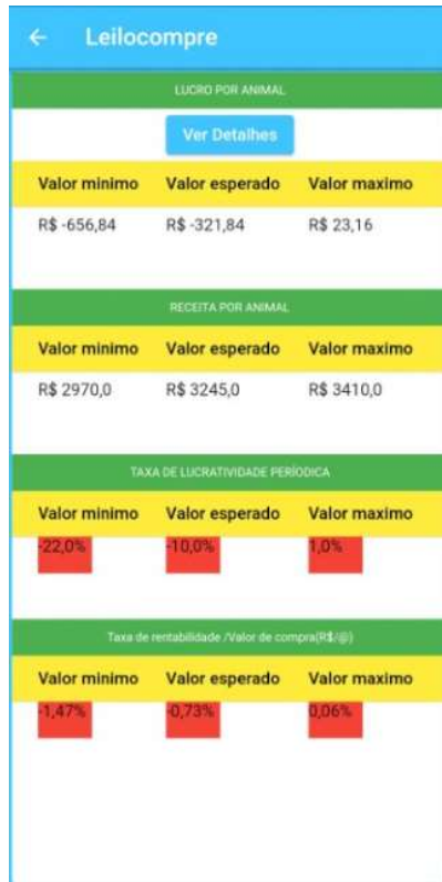
Figura 12. Terceira tela apresenta resultados para simulação de recria

A figura 12 demonstra claramente a dificuldade com a operação de recria com os dados inseridos nesta simulação. Operação se mostra arriscada com muitos valores negativos para o indicador Lucro por animal, mostrando a importância da gestão eficiente de compras por parte do produtor.