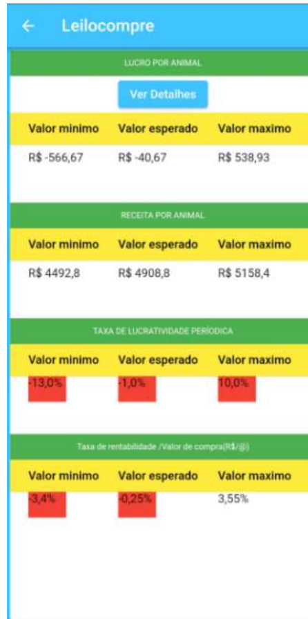
Figura 15. Tela apresenta resultados para operação de confinamento.

A figura 15 mostra a dificuldade para operação de confinamento para o ano de 2022, com margens apertadas, mas também apresenta possibilidades. Os valores mínimos e esperados para todos os indicadores se apresentaram negativos para a simulação.